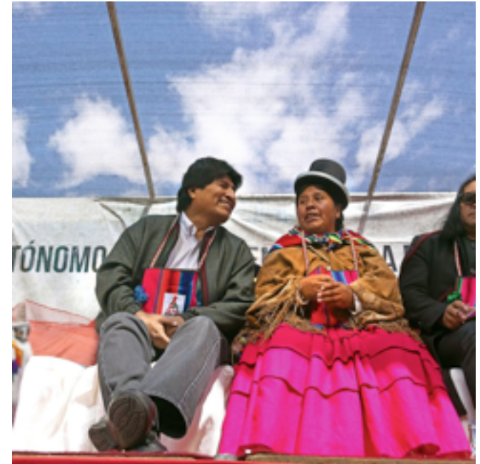
Evo Morales y mujer indígena

la llegada al poder: l'arrivée au pouvoir. 2. mal vistas : mal vues.